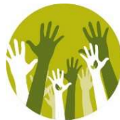
Image positive (communication autour de votre projet à travers la coopérative)

Solutions de financement adaptées à vos besoins (simple vente, leasing, vente de chaleur, ...)