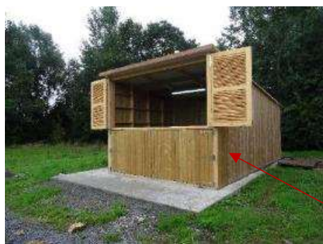
Silo de plaquettes de 30m 3

Chaufferie bois entièrement externalisée et reliée aux anciennes chaufferies par des tuyaux pré-isolés