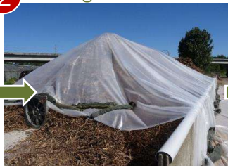
Séchage solaire et forcé avec la chaudière bois