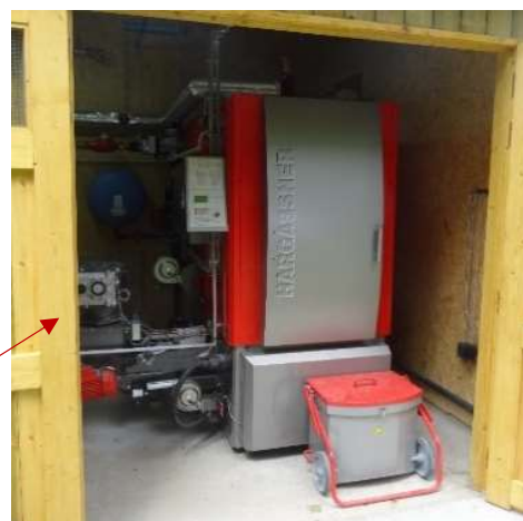
Chaudière de 200 kW