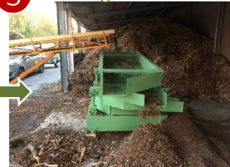
Dépoussiérage et élimination des longs morceaux

Le combustible ainsi produit alimente la chaudière du Moulin de la Hunelle, ainsi que d'autres chaudières des environs